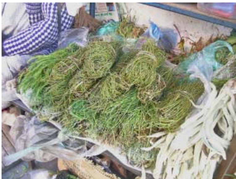
Fig. 3: Atados de Equisetum bogotense (Equisetaceae) que se venden en los mercados de plantas medicinales y rituales en puestos de chifleras en La Paz. Esta planta es recolectada también de los alrededores de la ciudad en ambientes húmedos.

En esta categoría se incluye a las plantas empleadas por el ser humano por su efecto placentero o por estar vinculadas a creencias y tradiciones. Varias especies de helechos han sido señaladas como sustitutos de coca ( Erythroxylum coca ) en varias partes dispersas de los Andes peruanos, en particular en Ayacucho y Cusco. Entre las especies substitutas están Asplenium foeniculaceum Kunth (Tryon 1959), Cheilanthes incarum Maxon (Herrera 1939), C. pruinata , Campyloneurum spp.