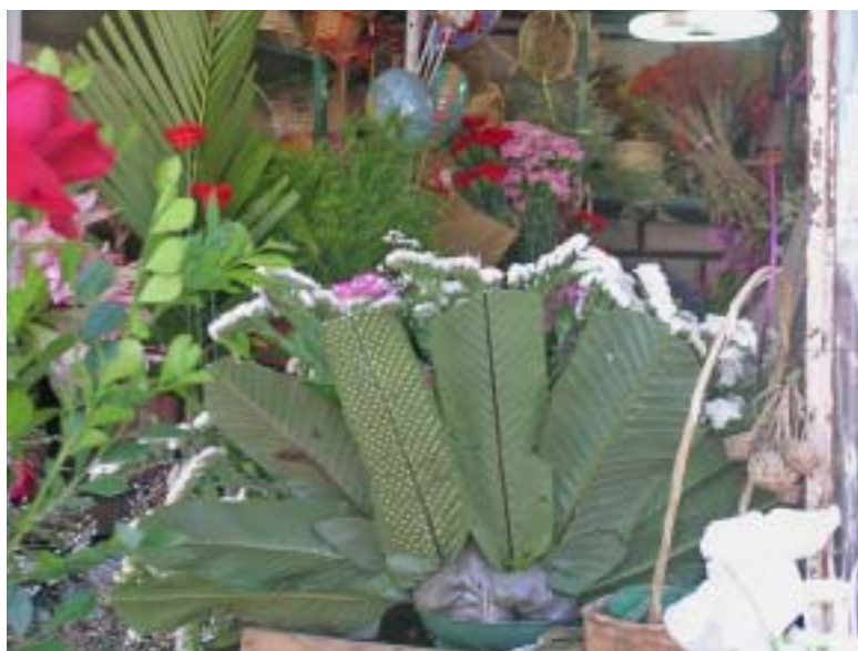
Fig. 2: Arreglo floral con frondes de Niphidium sp. (Polypodiaceae), que son comúnmente usadas en mercados de flores en La Paz (Bolivia) por ser duras y coriáceas. Se los cosecha de la parte alta de los bosques yungueños de La Paz a una hora de viaje desde la ciudad. No se tienen registros de su cultivo.

En Bolivia y principalmente en las ciudades, los helechos están siendo recolectados de los alrededores agrestes de las ciudades para ser llevados a las casas y plantados en macetas para ver si pueden sobrevivir. Sin embargo, se tienen especies que son ampliamente usadas en los mercados de las ciudades grandes para ser vendidos en arreglos florales. Las especies recopiladas con este fin son Niphidium y Nephrolepis sp. (Fig. 2), supuestamente porque sus hojas duran bastante tiempo sin agua.